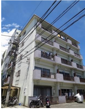
☆エレベーター付きRCマンション