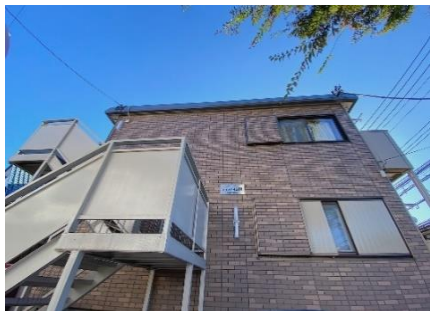
☆バス通りに面した立地