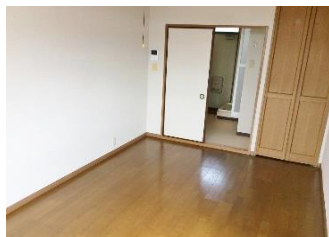
☆日当たりのいいお部屋です