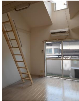
☆天窓もあり明るいお部屋です