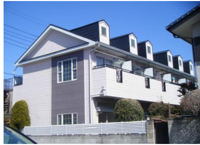
☆閑静な住宅街に立地