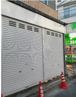
☆商店街沿い(1Fの路面店)