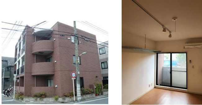
川沿いの静かなお部屋です♪